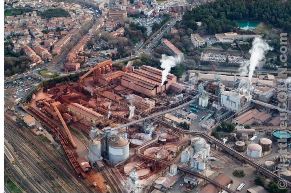
Vues aériennes de l'usine Alteo de Gardanne - Matthieu COLIN . Source: Google