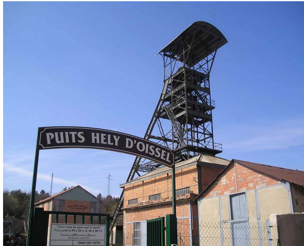
Musée de la Mine de Gréasque