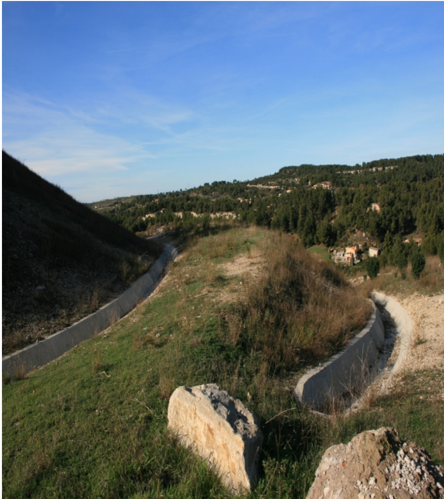
Terril du Grappon (Meyreuil)