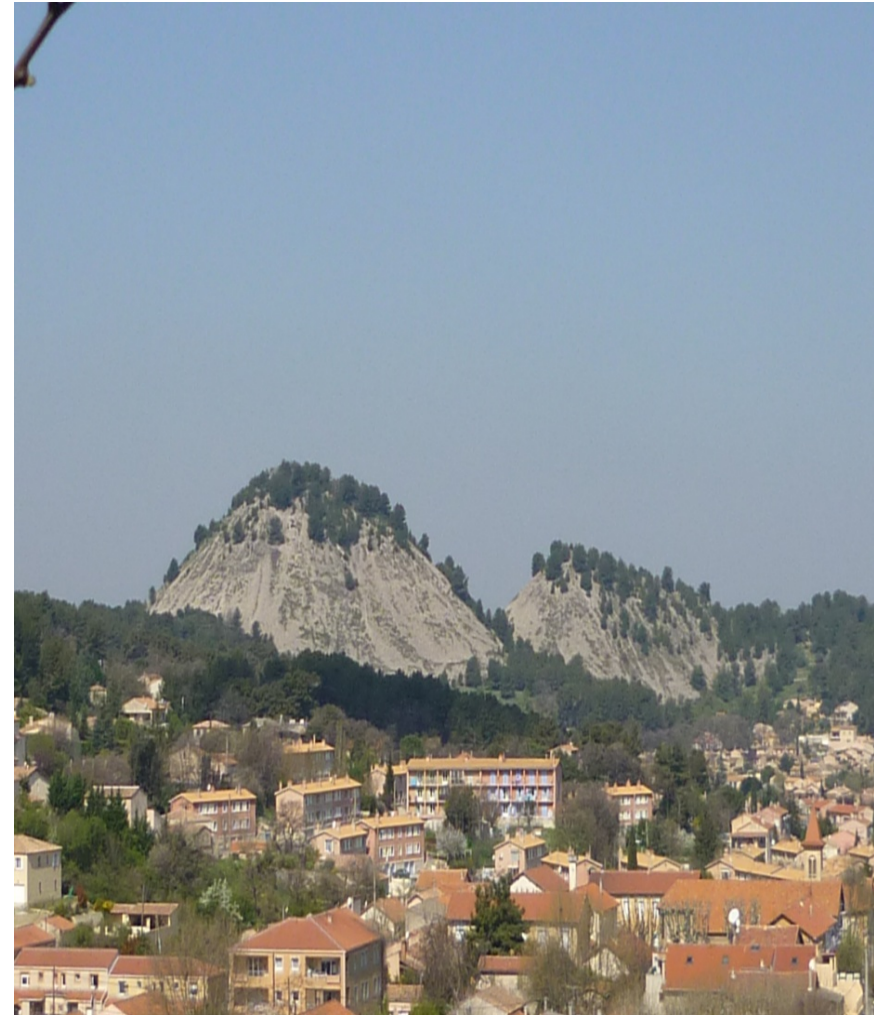
Terril des Molx (Gardanne-Simiane)